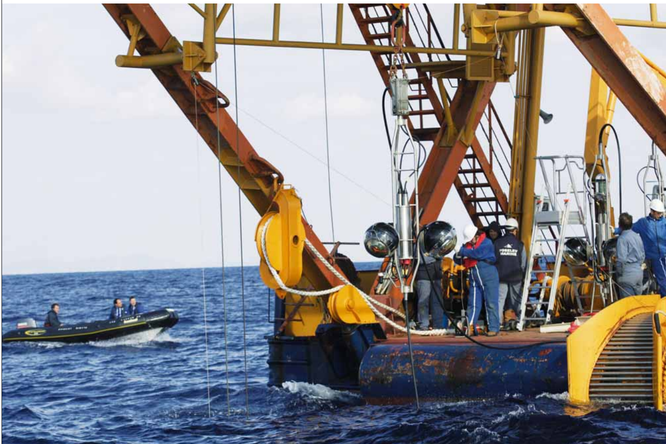
Immersion d'un étage à trois « yeux » lors du déploiement de la première ligne d'Antarès à 40 kilomètres de la Seyne-sur-Mer.

S' il est un lieu où une personne non initiée n'irait pas chercher un télescope, c'est bien dans les profondeurs marines. Pourtant, l'expérience Antarès (pour Astronomy with a Neutrino Telescope and Abyss environmental RESearch ) observe les cieux par 2 500 mètres au fond de la mer Méditerranée, à 40 kilomètres au large de Toulon. Placer un télescope observant vers le bas, à travers la terre, et donc à l'inverse des instruments tournés vers le ciel, pourrait paraître saugrenu a priori . Pour les chercheurs, il s'agit d'un endroit qui pourrait permettre de contribuer à résoudre une énigme encore indéchiffrée de l'astrophysique : l'origine du rayonnement cosmique qui pourtant bombarde l'atmosphère en permanence. Pour comprendre l'expérience Antarès, il faut savoir que les rayons cosmiques les plus énergétiques naissent d'événements comme les échanges de matière dans les étoiles binaires, l'explosion de supernovae dans la Voie lactée , les jets des noyaux actifs de galaxies ou les sursauts gamma dans les zones plus éloignées du cosmos. Il faut savoir encore que les photons gamma, aux énergies les plus extrêmes, ne permettent de sonder les phénomènes cataclysmiques que dans la proche banlieue de la galaxie. Difficulté supplémentaire : les particules constituant le rayonnement cosmique – pour l'essentiel des protons – sont rapidement arrêtées ou, à plus basse énergie,