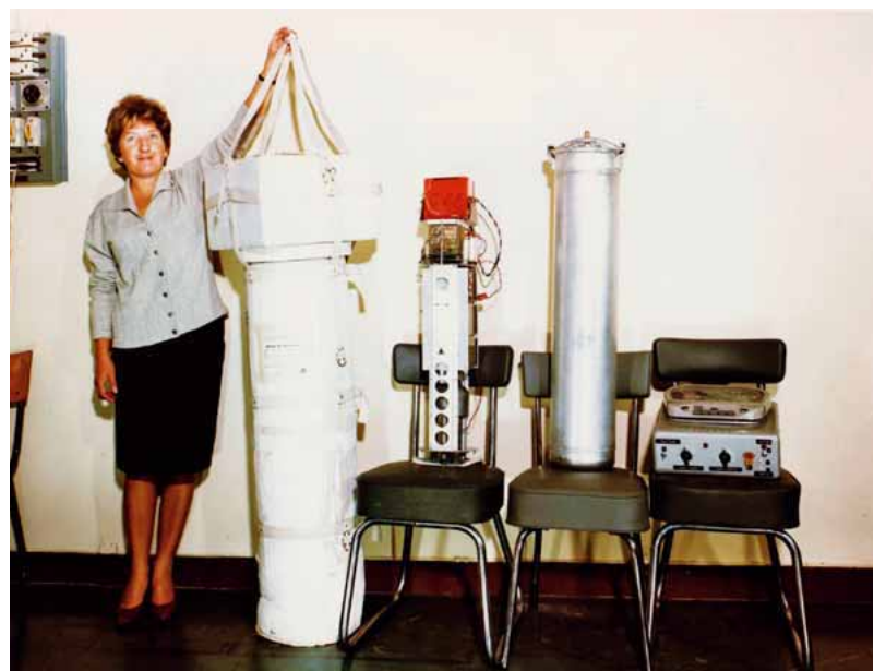
Charge portée par le ballon : détecteurs protégés du vide dans une cocotte-minute étanche et données enregistrées sur un magnétophone à bande récupéré après le vol (mai 1965).

cocotte-minute et du polystyrène ; pour enregistrer leurs données, ils ne disposent que d'un simple magnétophone à bande du commerce. Récupéré après le vol, ce simple enregistreur offrira au CEA l'une de ses premières historiques : la détection de rayons X de haute énergie émanant de plusieurs sources situées dans la constellation du Cygne. Pourtant, les chercheurs n'en sont qu'à leurs premiers étonnements. En 1967, des radioastronomes anglais découvrent des signaux radio rapides et réguliers dans le ciel. Une fois écartée l'hypothèse, brièvement envisagée, de signaux émis par des extraterrestres, une autre supposition voit le jour : ces « pulsations » proviendraient d'étoiles à neutrons, en rotation très rapide, baptisées pulsars pour pulsating stars .