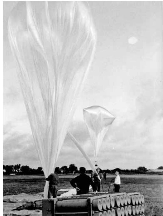
Découverte des rayons X cosmiques : préparation et envoi d'un ballon stratosphérique depuis Aire-sur-l'Adour (mai 1965).

Le 21 mai 1965, un vol inaugural se déroule sur la base d'Aire-sur-l'Adour (Landes) avec les moyens du bord. Par exemple, pour protéger les détecteurs du vide et du froid, les astrophysiciens utilisent une