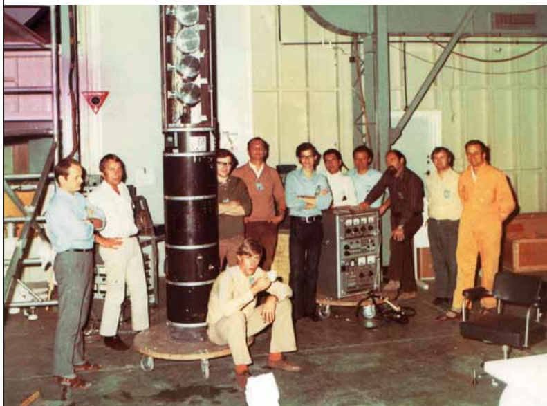
Ensemble de fusée Skylark pour la détection des sources célestes de rayons X (1972).

L'exploration du domaine des hautes énergies X et gamma se poursuivra jusqu'à aujourd'hui grâce à l'implication du CEA dans les missions SIGMA/Granat (1989), XMM-Newton (1999) et INTEGRAL (2002). Désormais, la vision des astrophysiciens s'ouvre sur des milliers de sources témoignant de cet Univers violent où les températures se chiffrent en millions de degrés. En revanche, du côté du rayonnement infrarouge, les obstacles ne se laisseront pas vaincre facilement : d'abord, l'atmosphère reste un écran à franchir et ensuite, la technologie des détecteurs, issue du domaine militaire, ne suit pas toujours les besoins des