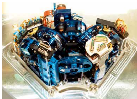
Caméra ISOCAM pour l'infrarouge (novembre 1995).

Aujourd'hui, dans le vaste arc-en-ciel de l'invisible, un seul domaine demeure encore inexploré : celui de l'infrarouge lointain, proche des ondes radio. Pour relever ce nouveau défi de l'observation de ce rayonnement de très faible énergie, il faut repousser encore plus loin les limites actuelles de la technologie. La caméra du futur est équipée de détecteurs spécifiques, appelés bolomètres. Le défi consiste à éviter qu'elle ne se fasse aveugler par son environnement. Pour y parvenir, les astrophysiciens doivent obtenir leur refroidissement jusqu'à quelques millidegrés au-dessus du zéro absolu. Certaines de ces caméras fonctionnent déjà depuis le sol à partir d'étroites fenêtres atmosphériques laissant passer une partie de ce rayonnement. Mais la première grande exploration se fait désormais depuis l'espace grâce au satellite Herschel de l'Agence spatiale européenne (ESA) lancé avec succès le 14 mai 2009. À son bord, il emporte PACS (pour Photoconductor Array Camera and Spectrometer ), caméra dotée de la plus grande matrice de bolomètres jamais construite, un succès majeur pour le CEA. Comme toutes les vraies