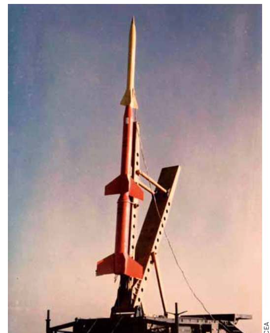
La première expérience spatiale du CEA, le 27 janvier 1959. Un compteur Geiger a été installé à bord d'un missile pour une des premières mesures des rayons gamma du ciel.

Bien sûr, cette mission, dirigée par le physicien Jacques Labeyrie, doit répondre prioritairement aux interrogations posées par les expérimentations nucléaires