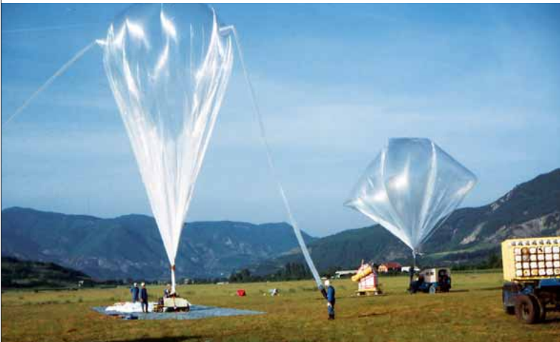
Découverte du rayonnement gamma des pulsars. Charge et ballon stratosphérique à Aire-sur-l'Adour (juillet 1969).

Pendant plus de 2 000 ans, les astronomes ont été dans l'ignorance des lumières baignant le cosmos, excepté, bien sûr, de la lumière visible. Et pour cause : la plupart des rayonnements ne parviennent pas à franchir la barrière que leur oppose l'atmosphère. Dépasser cet obstacle supposait des instruments adaptés : d'abord des ballons puis des fusées et enfin des satellites.